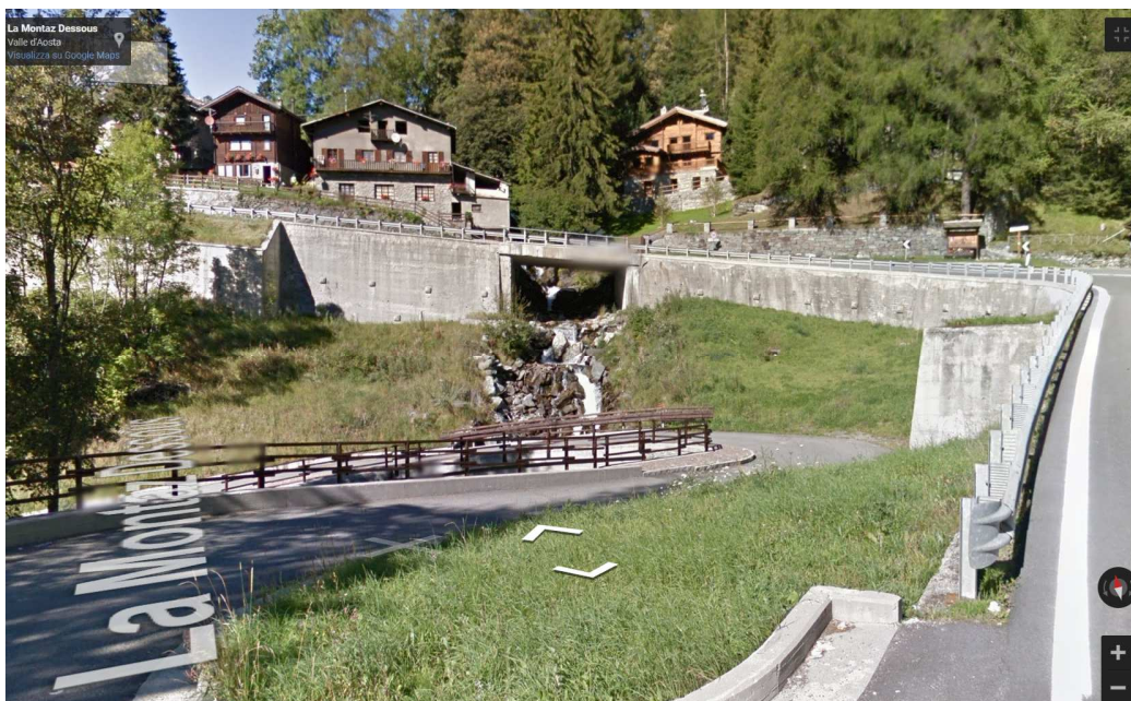
Vista della Zona dell'intervento, con ben visibile il Ponte sul Marmore e i terrapieni a sostegno della Strada Regionale n. 46 della Valtournenche.