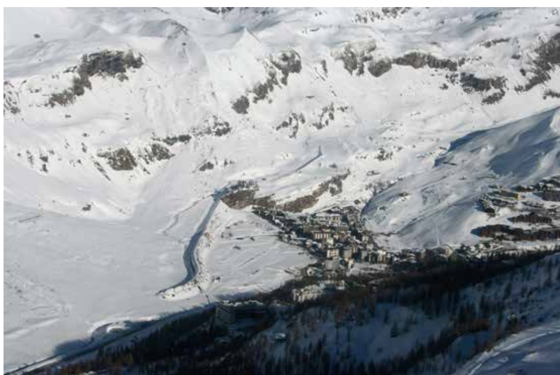
Региональный Кадастр Лавин - Управление Снега и Лавины - РАВА Дамба Бреули-Матерхорн.

Существуют сооружения прямого и пассивного характера по защите от лавин. Это защитный туннель перед въездом в Матерхорн и защитная дамба на высоте Бреули- Матерхорн.